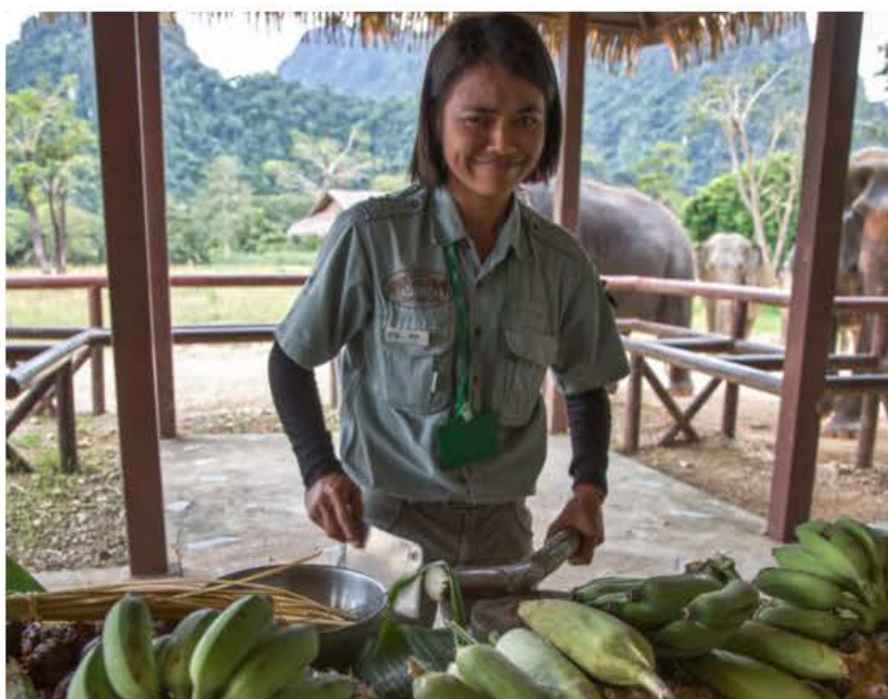
Bua er i færd med at hakke et sukkerør i mindre stykker, inden det skal serveres for elefanterne.