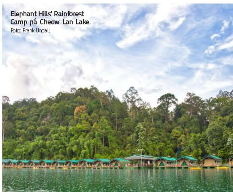
Elephant Hills' Rainforest Camp på Cheow Lan Lake.