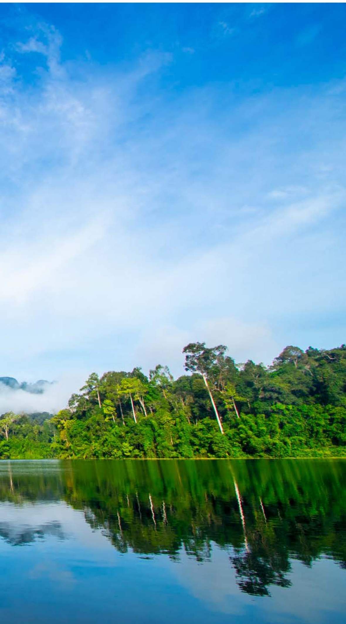
Cheow Lan Lake ligger midt i Khao Sok National Park. Søen blev dannet i 1982, da Electricity Generating Authority of Thailand byggede Rajjaprabha-dæmningen.