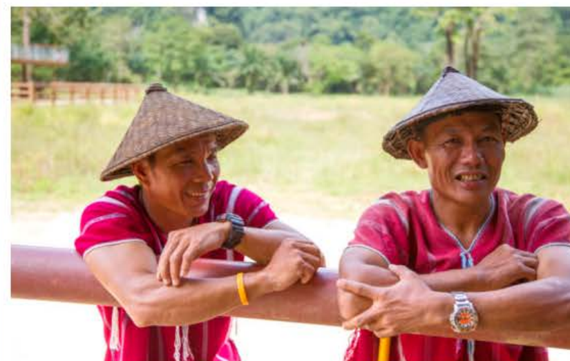
Mahouterne starter typisk som drenge, hvor de bliver tildelt en elefant, som de hele livet har ansvaret for.