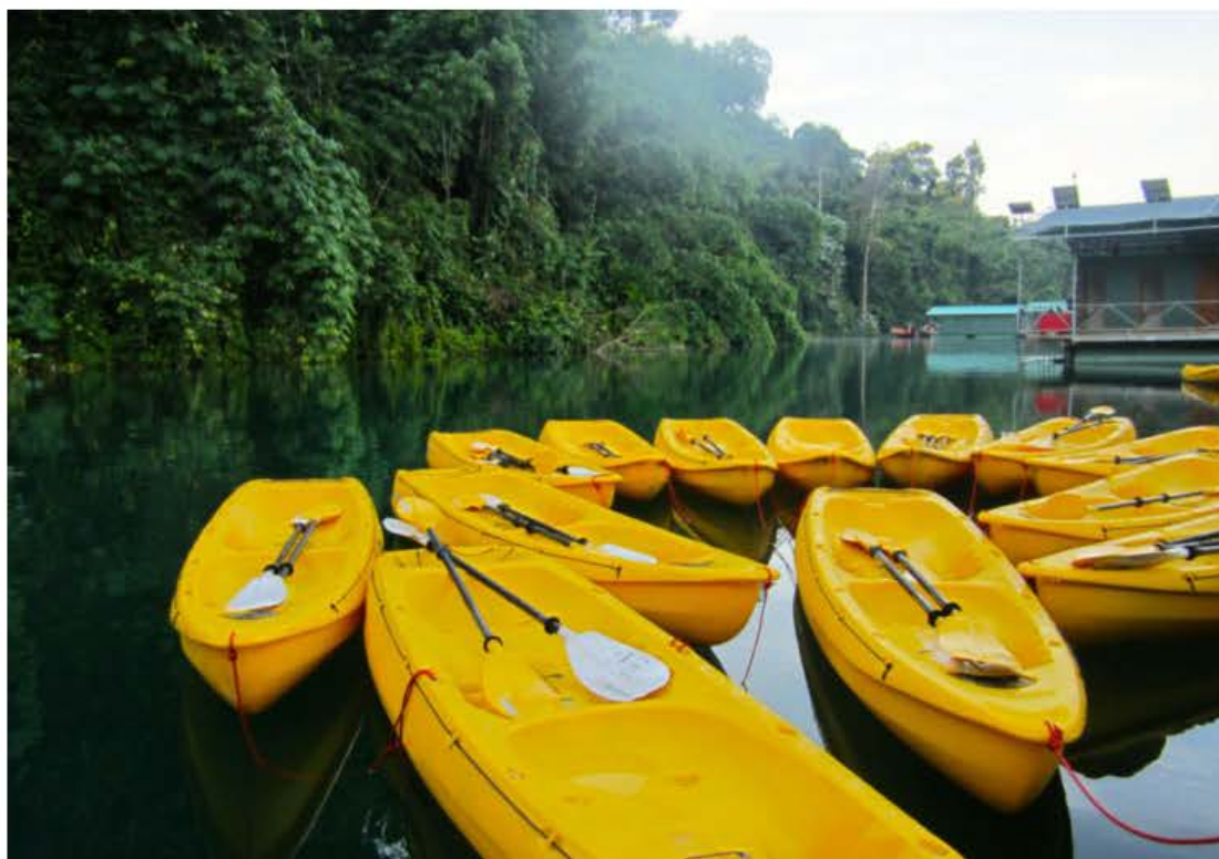
Der er rig mulighed for sejlture på søen på egen hånd. Hvert telt er udstyret med en kajak.