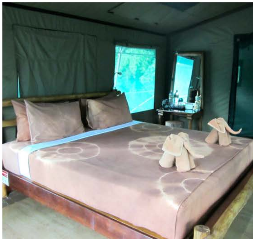
Teltene er alle udstyret med bad og toilet.