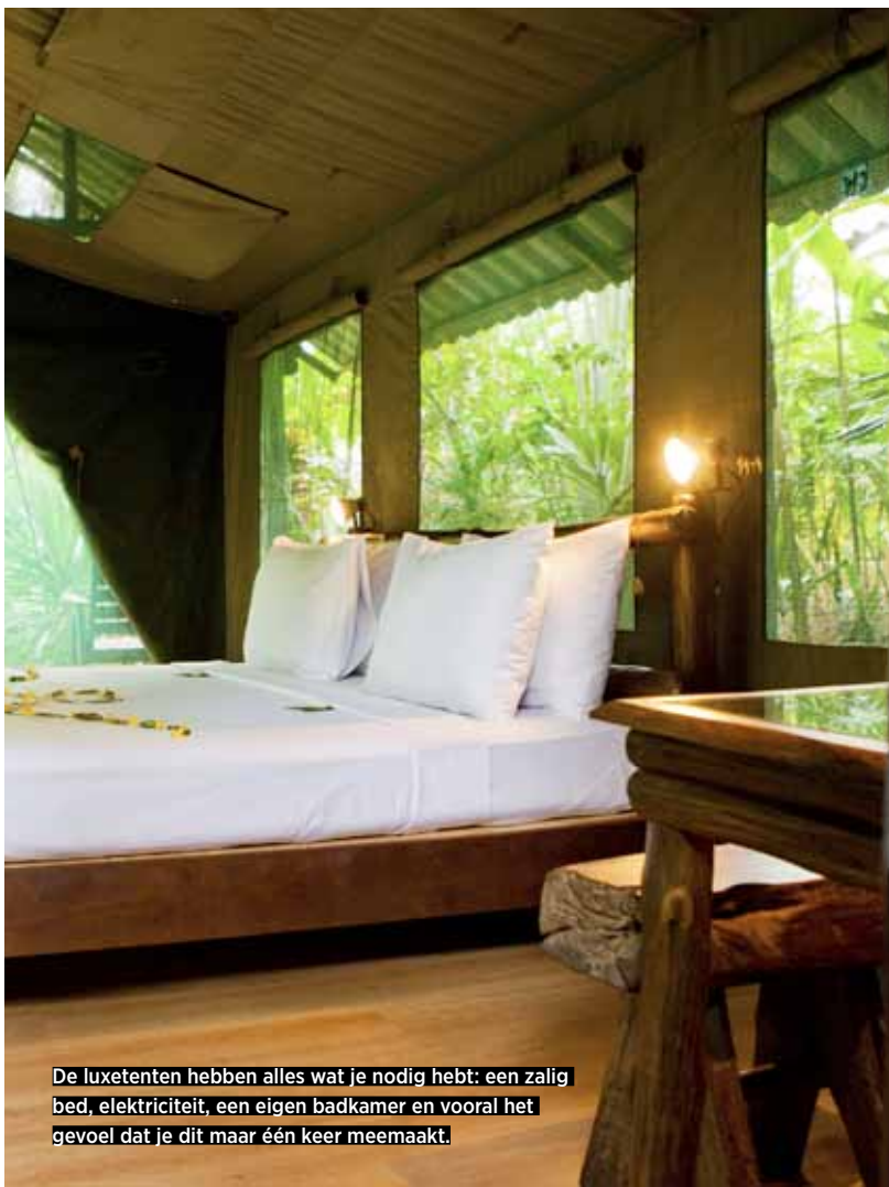
De luxetenten hebben alles wat je nodig hebt: een zalig bed, elektriciteit, een eigen badkamer en vooral het gevoel dat je dit maar één keer meemaakt.