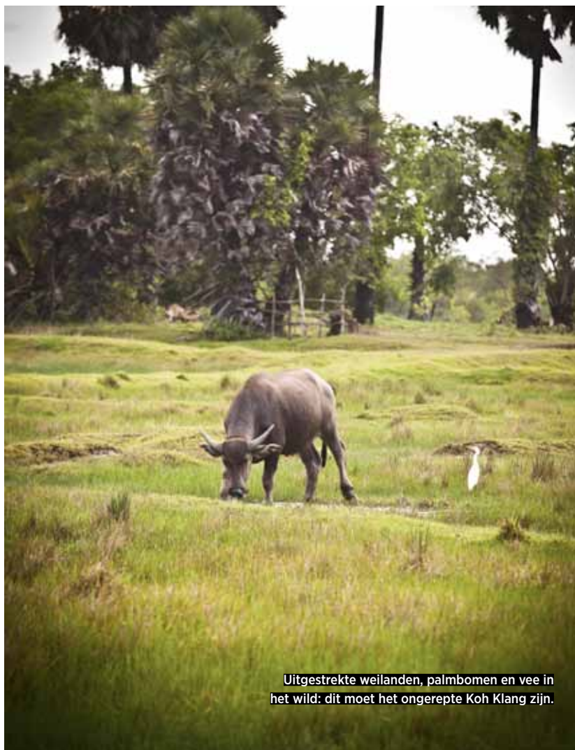
Uitgestrekte weilanden, palmbomen en vee in het wild: dit moet het ongerepte Koh Klang zijn.