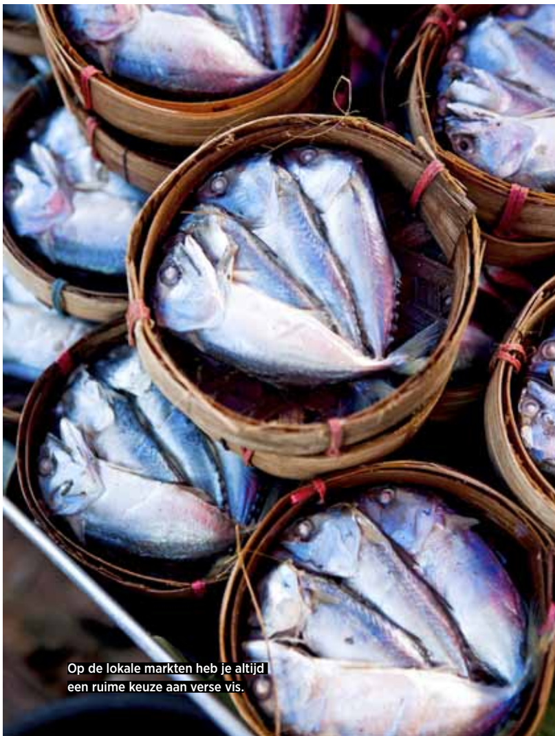
Op de lokale markten heb je altijd een ruime keuze aan verse vis.