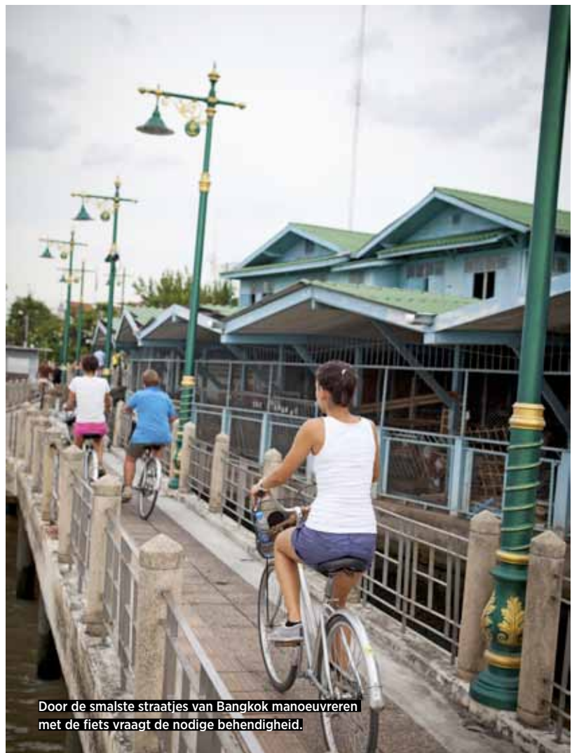
Door de smalste straatjes van Bangkok manoeuvreren met de fiets vraagt de nodige behendigheid.

Lampang ligt in het noorden van Thailand en is goed bereikbaar via een binnenlandse vlucht vanuit Bangkok. Voor de meer avontuurlijke reizigers zijn er ook busverbindingen met de steden Lamphun, Chiang Mai, Phitsanulok en Bangkok. ▶