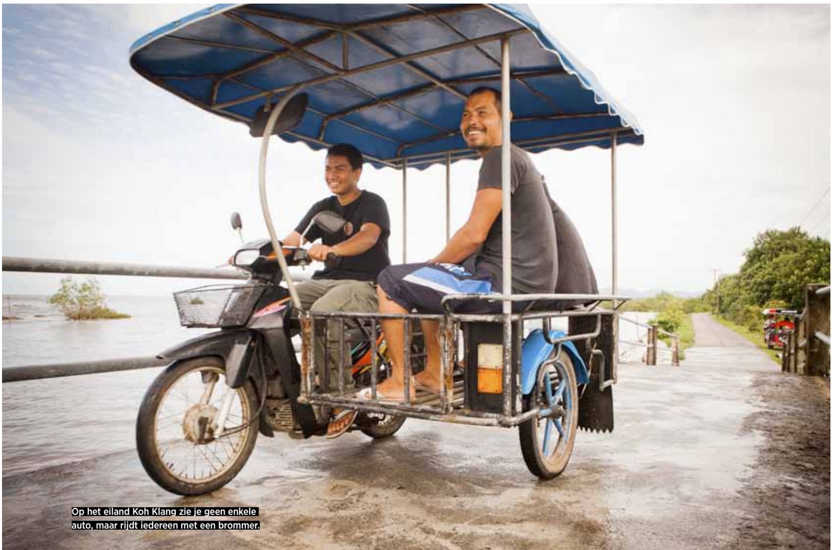
Op het eiland Koh Klang zie je geen enkele auto, maar rijdt iedereen met een brommer.