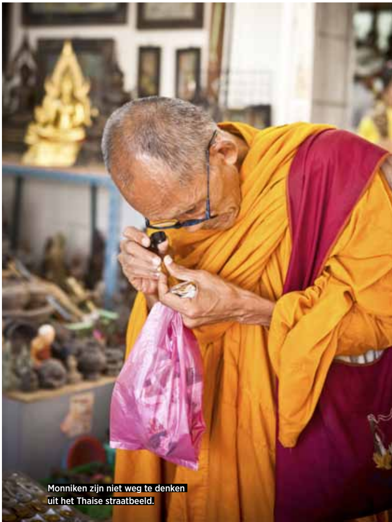
Monniken zijn niet weg te denken uit het Thaise straatbeeld.