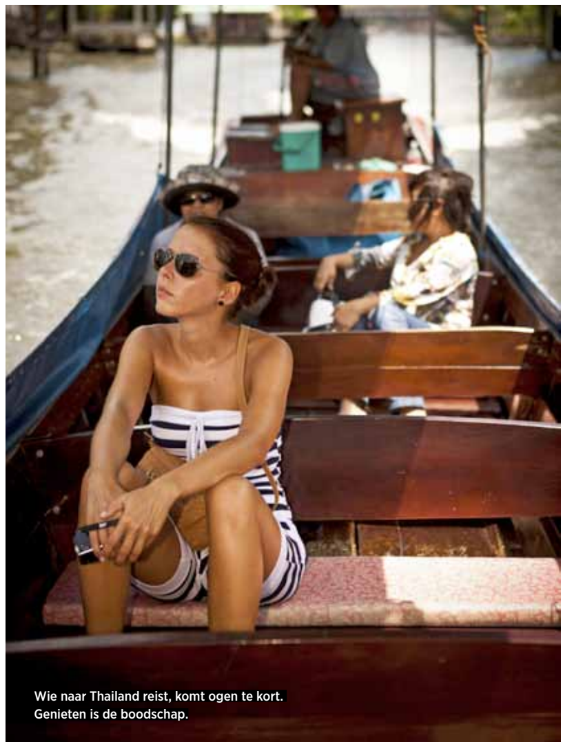
Wie naar Thailand reist, komt ogen te kort. Genieten is de boodschap.

2. Tijdens ons verblijf in Krabi slapen wij in het Rayavadee Resort aan het sprookjesachtige Railay Beach : riante, luxueuze kamers, topservice en een (h)eerlijke Thaise keuken. Ben je meer op zoek naar een strak, modern en hip hotel, maar met aandacht voor de natuur? Dan is het Beyond Resort een aanrader. Rayavadee Resort, overnachting vanaf € 670 per kamer, www.rayavadee.com . Beyond Resort, overnachting vanaf € 117 per kamer, www.katagroup.com/beyond-krabi