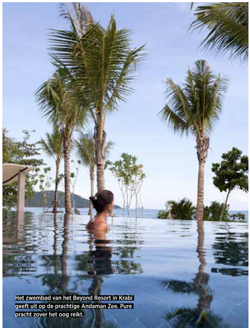
Het zwembad van het Beyond Resort in Krabi geeft uit op de prachtige Andaman Zee. Pure pracht zover het oog reikt.