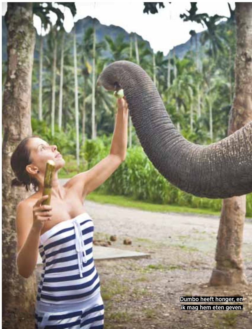
Dumbo heeft honger, en ik mag hem eten geven.