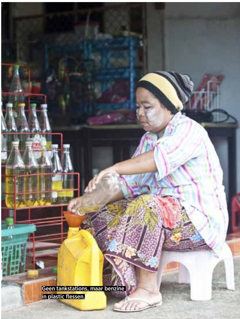
Geen tankstations, maar benzine in plastic flessen.