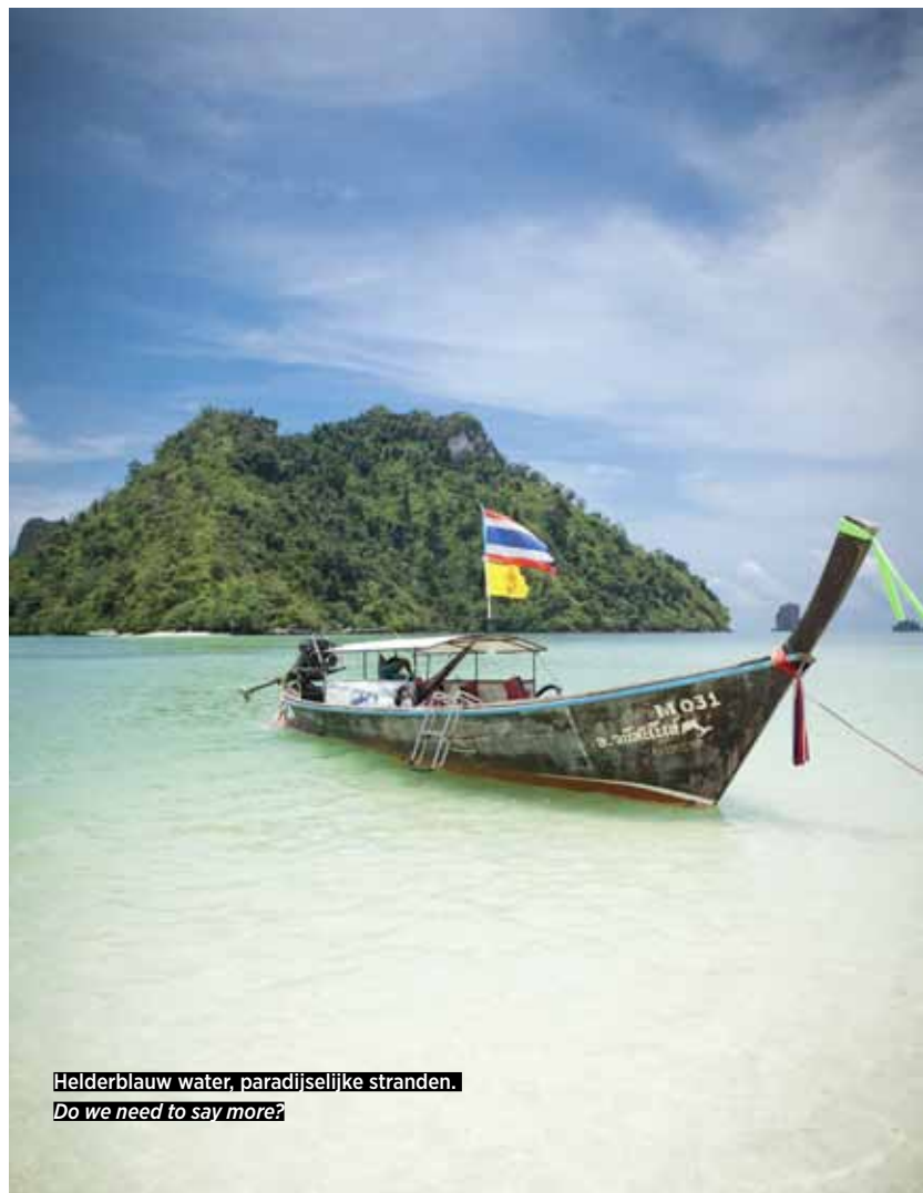
Helderblauw water, paradijselijke stranden. Do we need to say more?