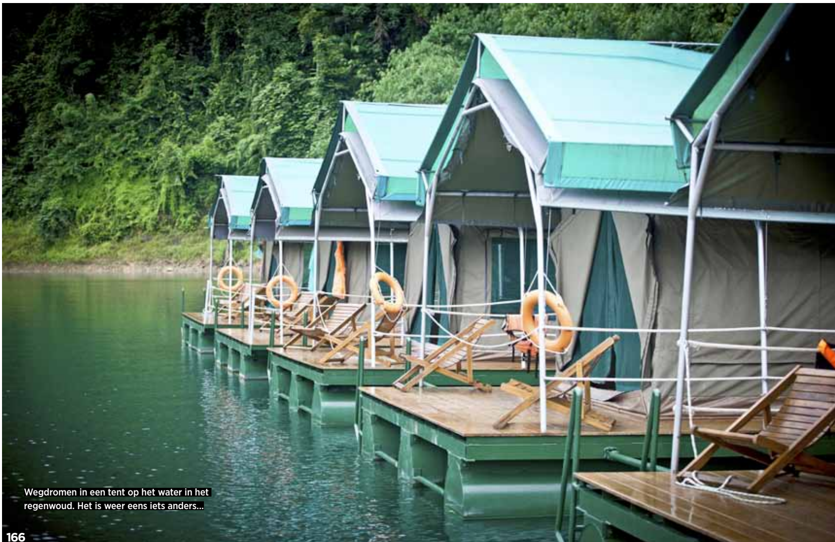
Wegdromen in een tent op het water in het regenwoud. Het is weer eens iets anders...