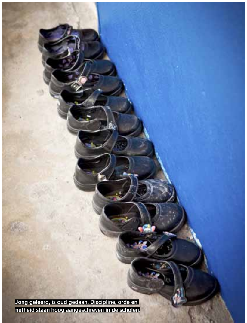
Jong geleerd, is oud gedaan. Discipline, orde en netheid staan hoog aangeschreven in de scholen.