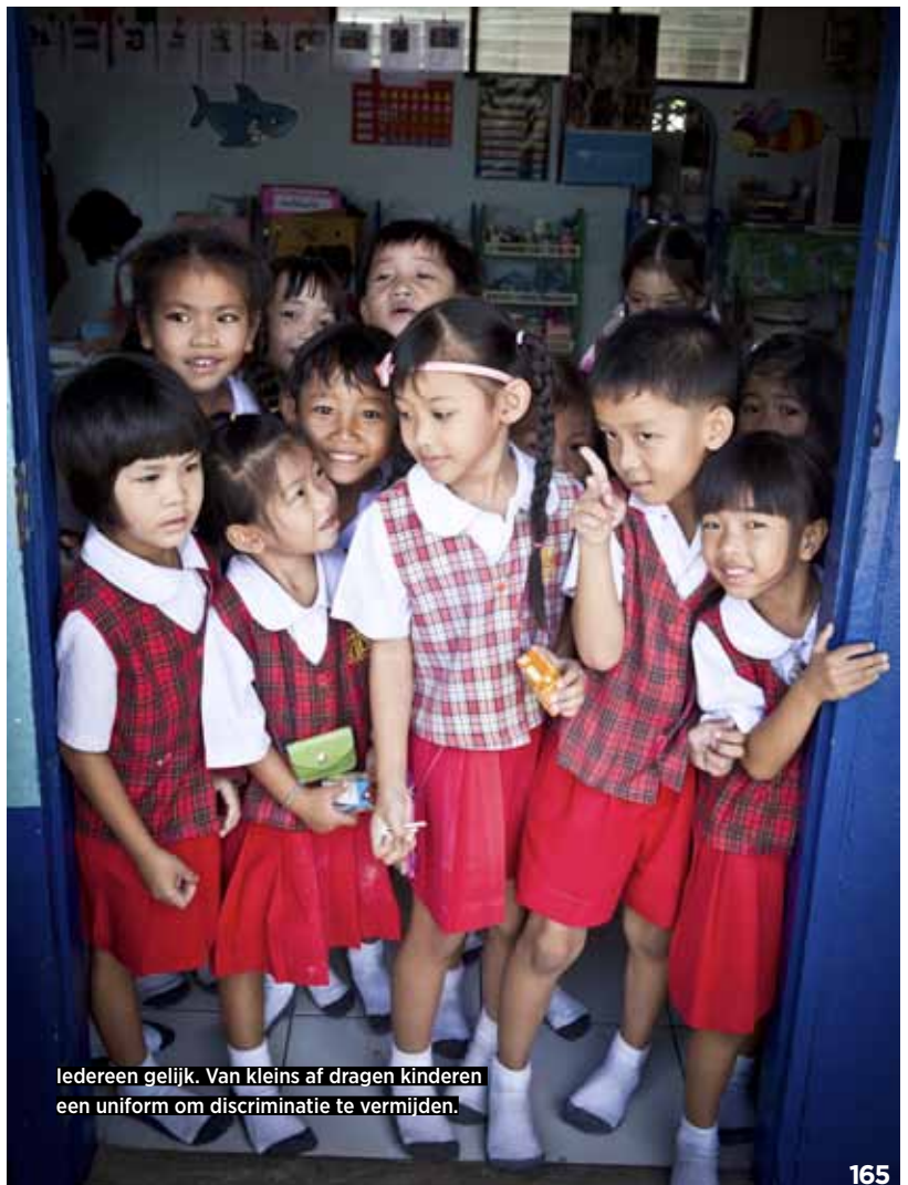
Iedereen gelijk. Van kleins af dragen kinderen een uniform om discriminatie te vermijden.