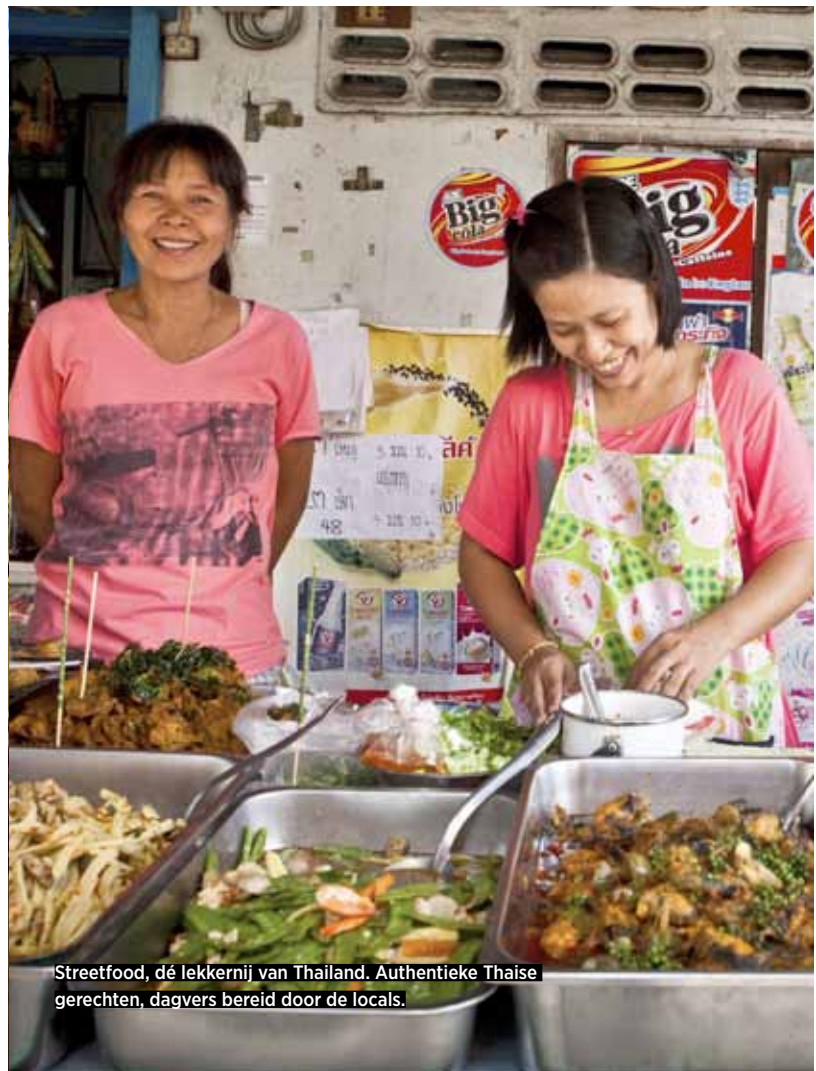
Streetfood, dé lekkernij van Thailand. Authentieke Thaise gerechten, dagvers bereid door de locals.